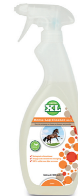
Horse Leg Cleaner